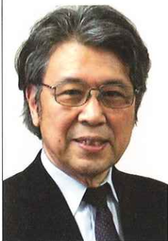
村上陽一郎 Murakami Yoichiro

近代ヨーロッパに始まる科学は、当初は科学者共同体の内部に自己完結した営みであり、社会とは明確に距離があった。しかし、20世紀中ごろから、産業や国家行政が科学研究のクライアントとなり、大きな成果を上げてきた。そして今、社会が科学・技術にどのようにガバナンスを発揮するのか、それが深刻に問われている。