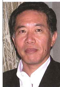
内田 樹 Uchida Tatsuru

ポスト3・11の日本社会はラディカルな制度の再編を余儀なくされている。日本はこれから「成長なき社会」(レヴィ=ストロースがかつて「冷たい社会」と呼んだもの)にゆっくり向かってゆくことは間違いない。制度疲労する様々な局面のホットイシューを取り上げ、問題を整理したい。